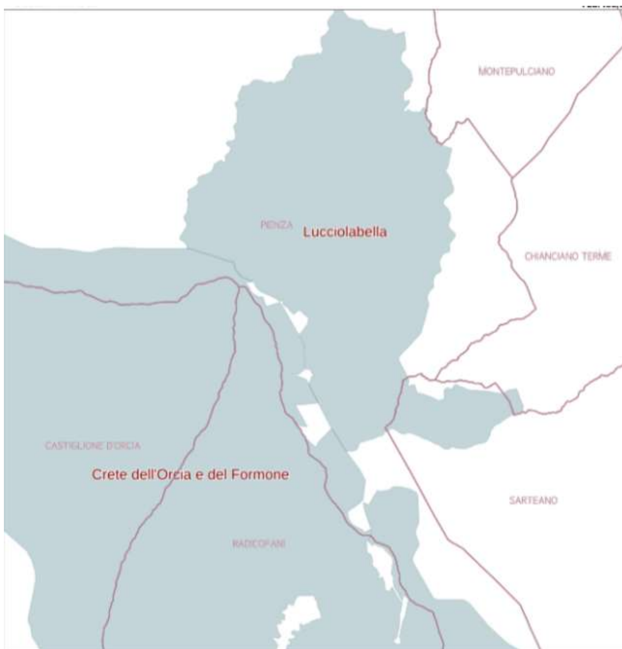
Figura 1. Localizzazione del SIC/ZPS