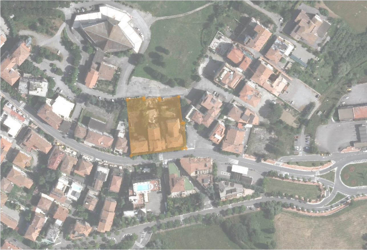
Stato Attuale: foto aerea con individuazione del comparto